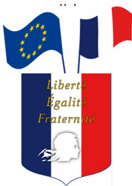
Lot 2 LEF