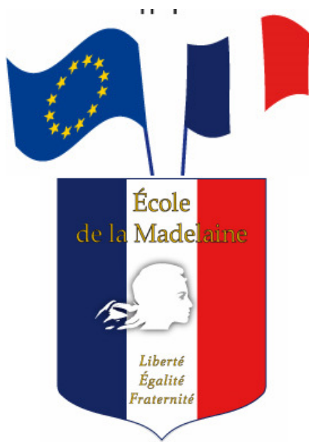
Lot 1 LEF