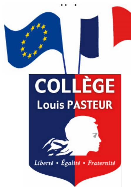
Lot 3 LEF